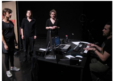
Photo de répétition/recherche création sonore

Enfin, le créateur sonore joue au clavier en direct pour soutenir les extraits d'interviews audio de la manière la plus organique possible.